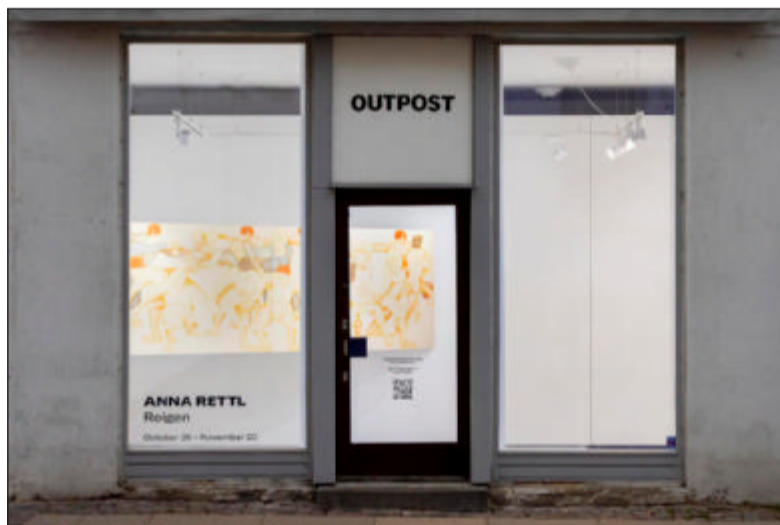
Udstillingerne hos Outpost er altid ophængt, så de kan ses fra gaden.