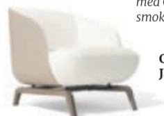
Giorgetti, Janet loungestol

Lago Design har udvidet deres serie af skænke, således der nu er flere attraktive kombinationsmuligheder. Her vist med Onice polished XGlass fronter, luta lacquer & bronze smoked glass struktur samt Peltro steel legs.