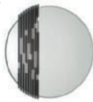
Giorgetti, Rift spejl