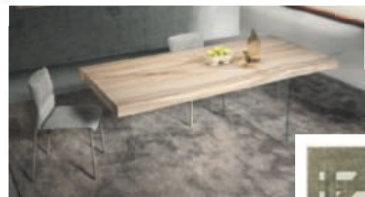
Lago Design, Air XGlass Table m/Onice Matt XGlass top & extra clear glass legs.