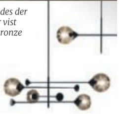
Giorgetti, Kendama pendler